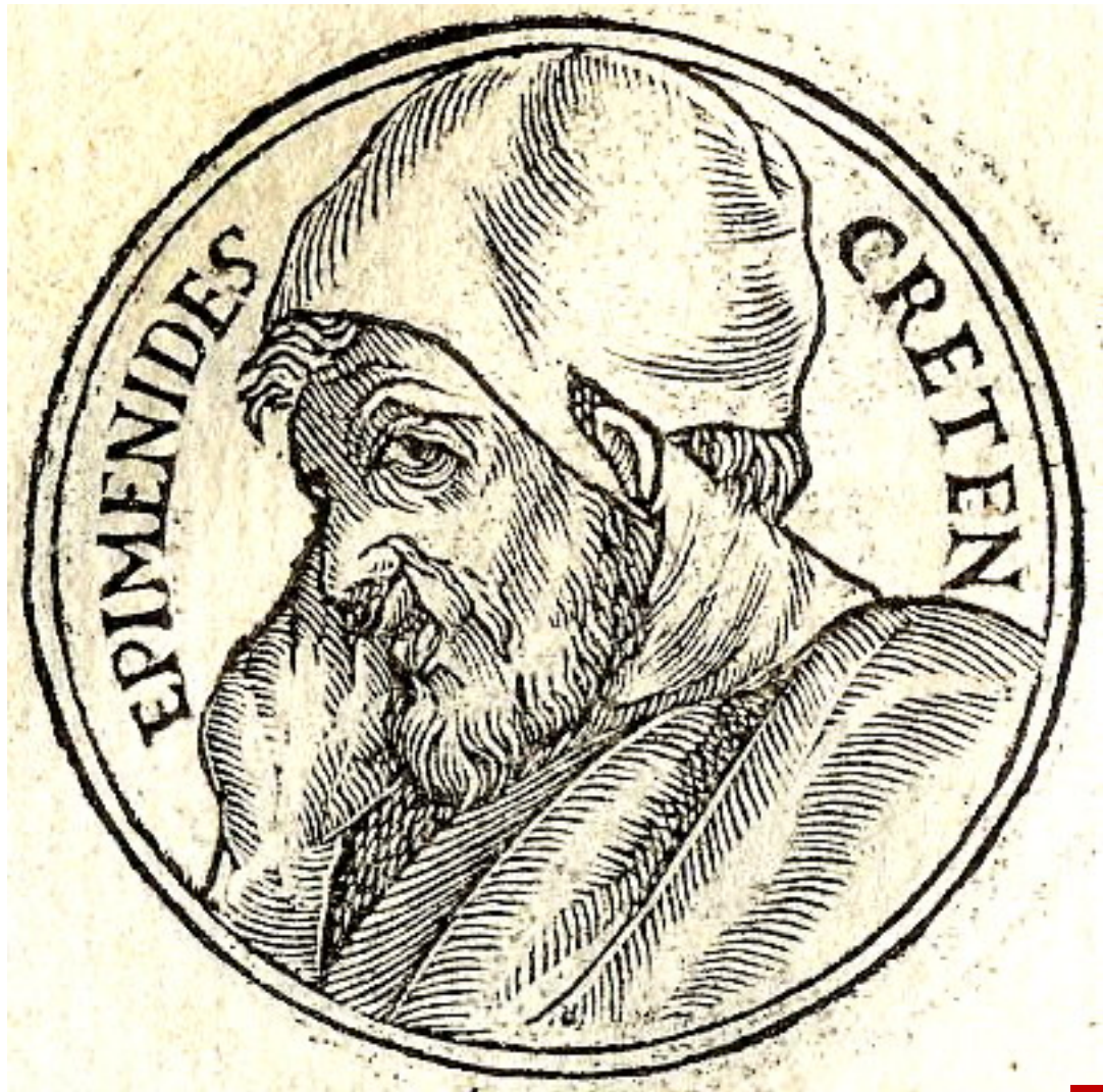
Epimenides，主前六世紀 革哩底人