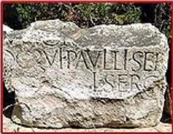
INSCRIPTION OF SERGIUS PAULUS, THE PROCONSUL IN PAPHOS. THIS INSCRIPTION WAS FOUND IN PISIDIAN ANTIOCH

士求保羅 (Sergius Paulus) 是個通達人，他請了巴拿巴和掃羅來，要聽神的道。(13:7)