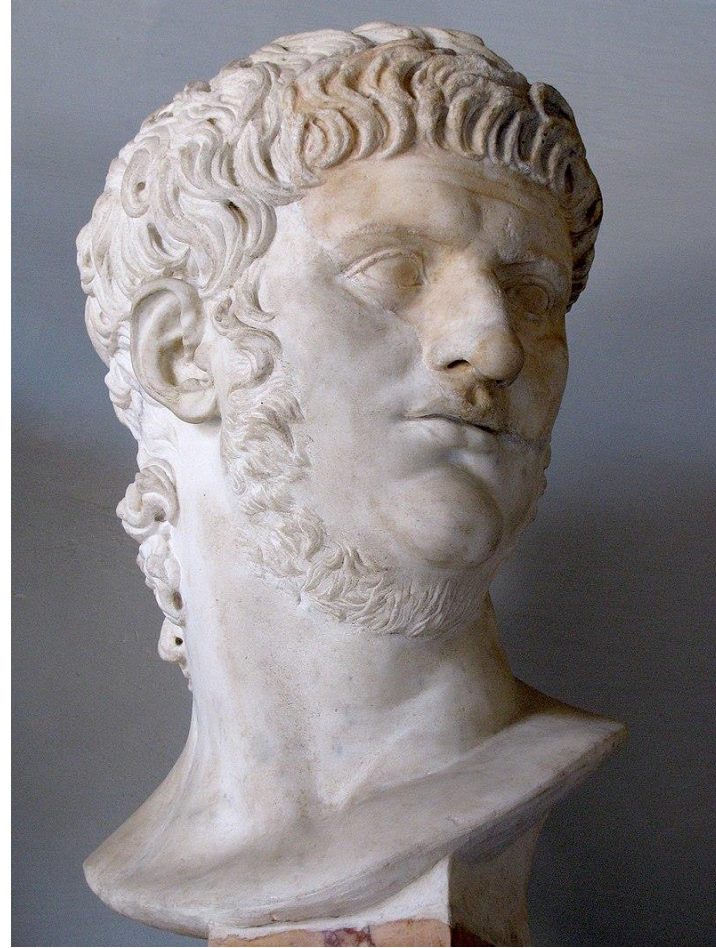
羅馬皇帝尼羅 Nero AD 54-68 在位