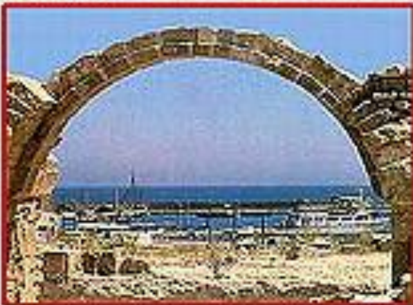
HARBOR AT PAPHOS

士求保羅是居比路 (Cyprus塞浦路斯) 的方伯，後來信主了。考古學家在塞浦路斯挖出一塊石頭，上面刻著士求保羅的名字。他的名字也出現在羅馬的一個拱門之上。