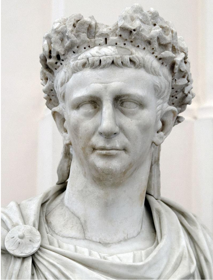
羅馬皇帝革老丟 Claudius AD 41-54 在位