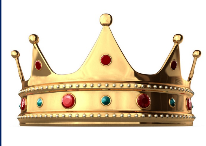
冠冕 Crown · 亞6:14