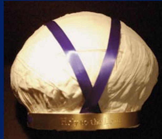
冠冕 Turban · 亞3:5