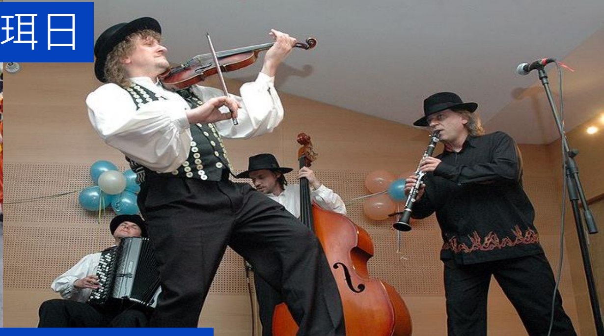
耶路撒冷（左上），普珥送禮（左下） 波蘭（右上），以色列 Holon（右下）