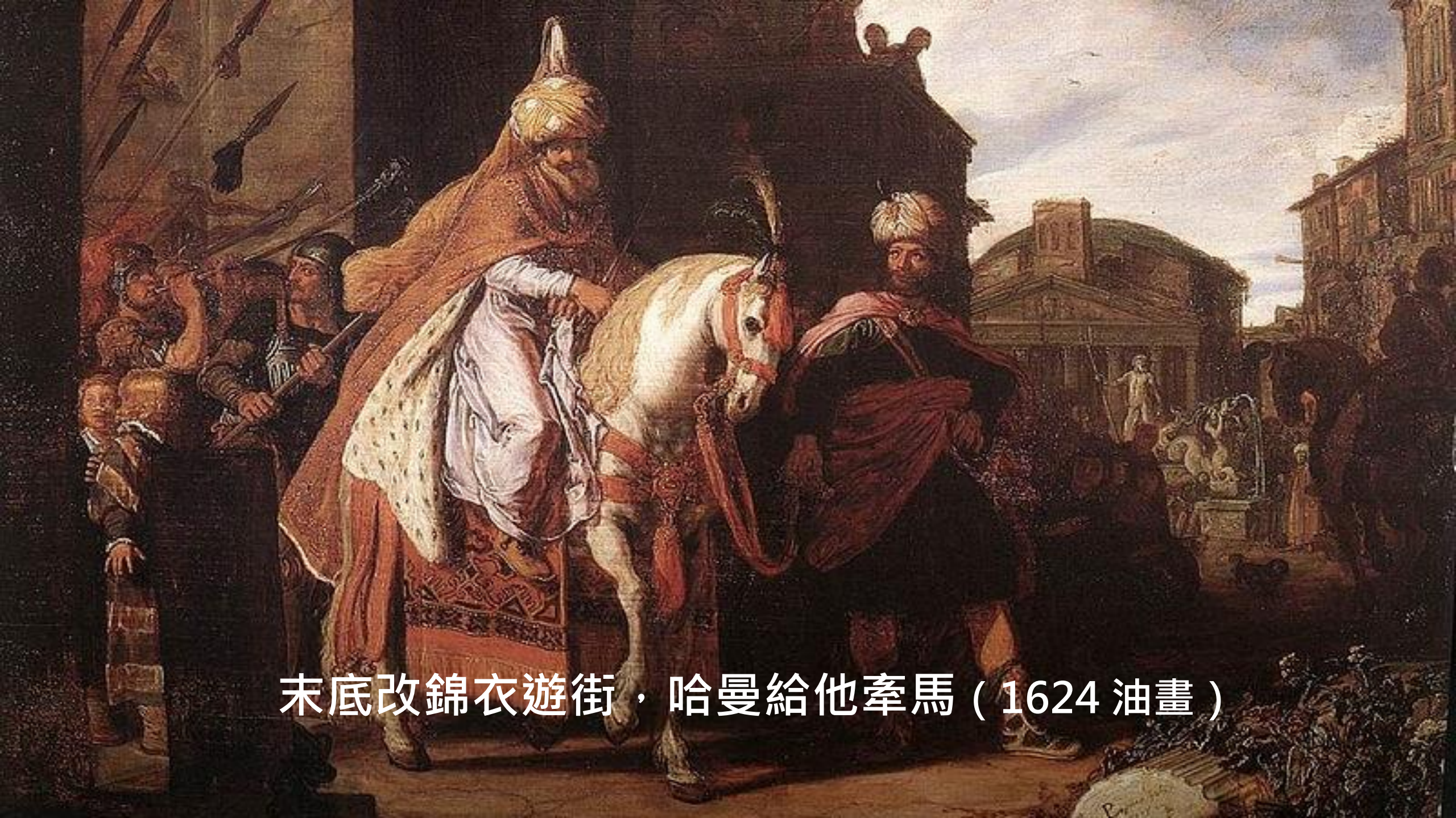
末底改錦衣遊街，哈曼給他牽馬（1624 油畫）