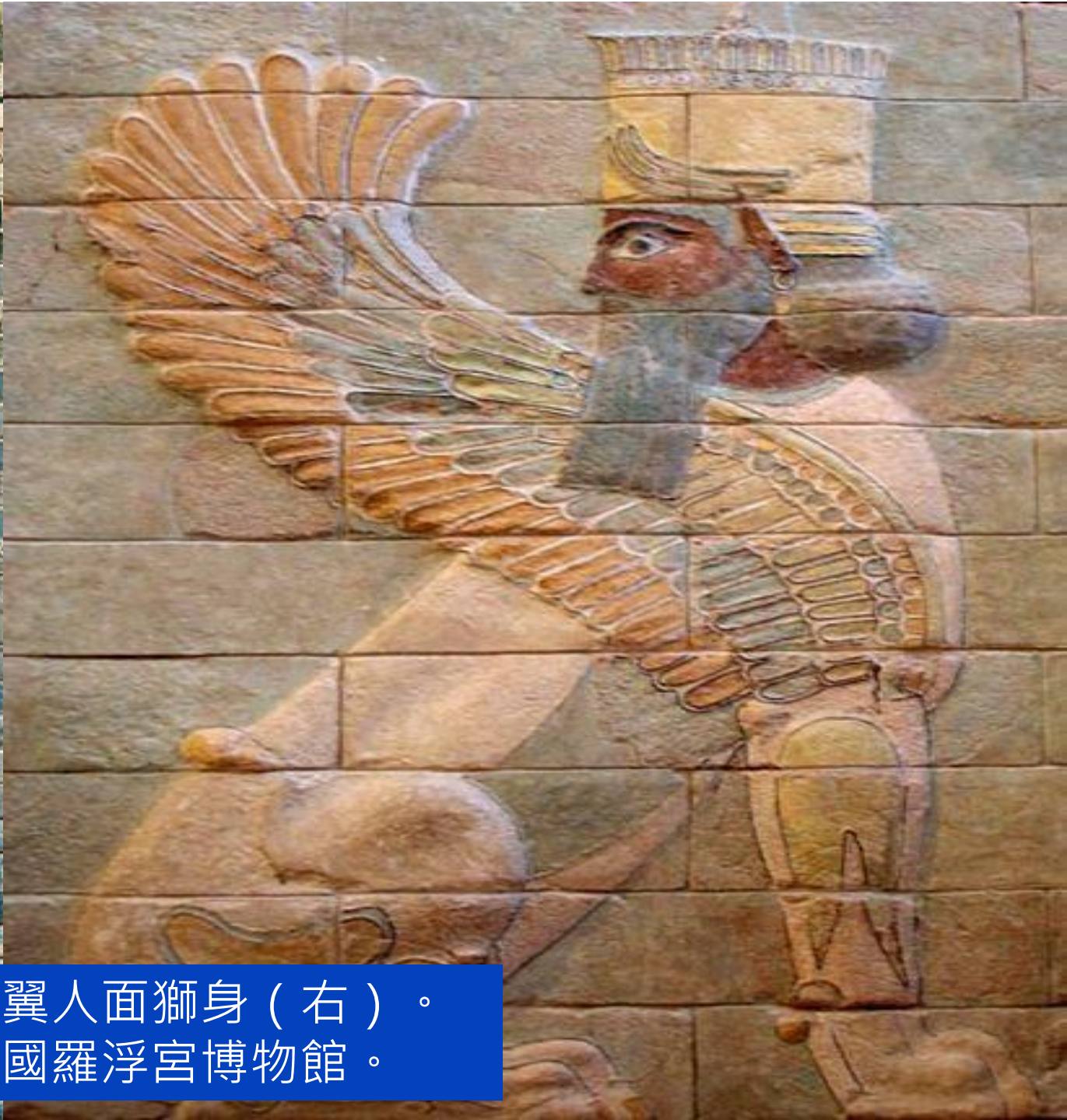
波斯弓箭手（左），帶翼人面獅身（右）。 原在書珊皇宮，現存法國羅浮宮博物館。