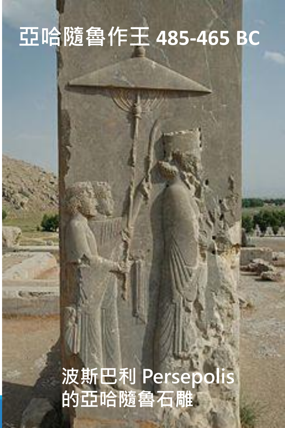
波斯巴利 Persepolis 的亞哈隨魯石雕